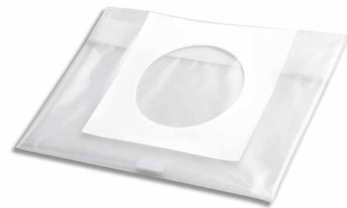
Operasyon Bölgesi İçin Sirt Örtüsü