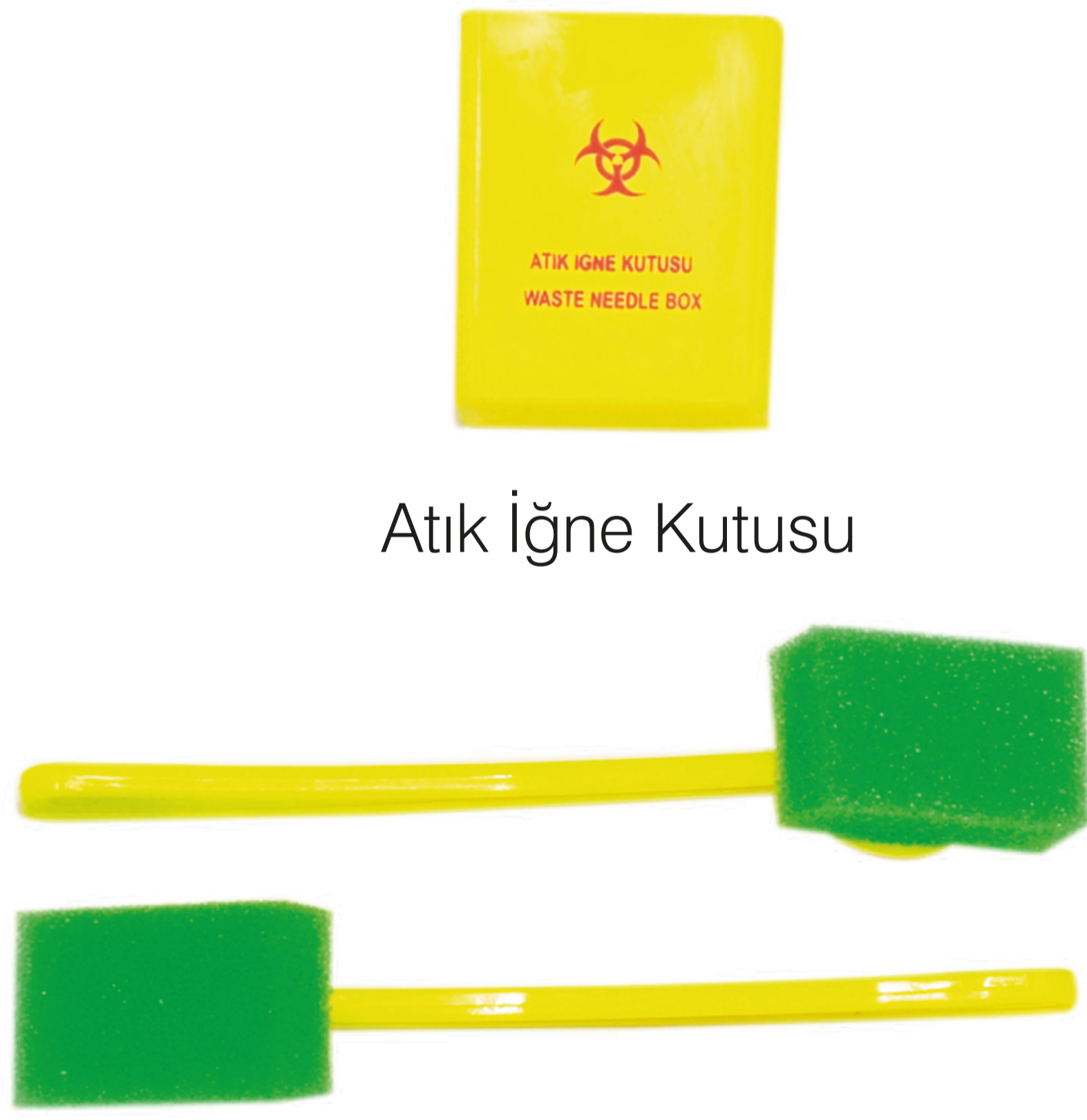
Atık İğne Kutusu

✓ Filtreli Aspirasyon Kanülü Flakondan çekilen ilacın enjektöre aspire edilirken filtre edilmesini sağlar (Cam partiküller için)